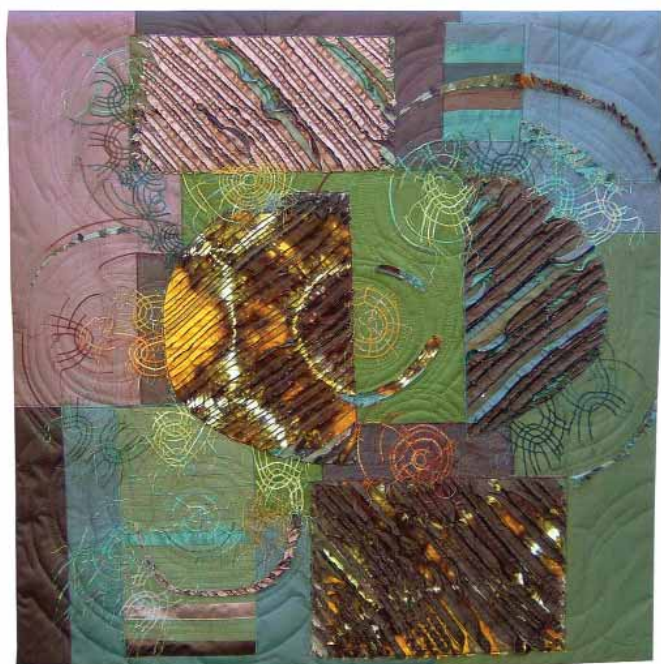
Dance of the Water Strider