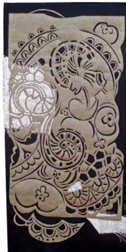
Tide of Life 1

Ha estado presente en el Festival of Quilts de Birmingham, en el Carrefour Européen du patchwork, o Rusia.